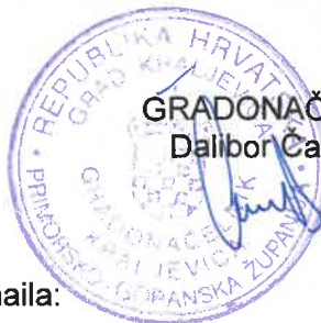
GRADONAČELNIK Dalibor Čandrić

Slijedom navedenog odlučeno je kao u izreci.