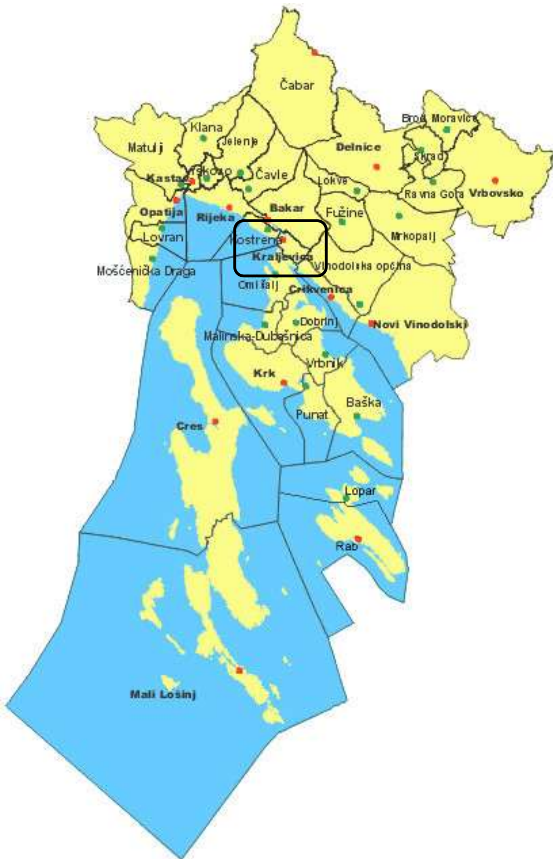
Slika 1. Položaj Grada Kraljevice u odnosu na Primorsko-goransku županiju