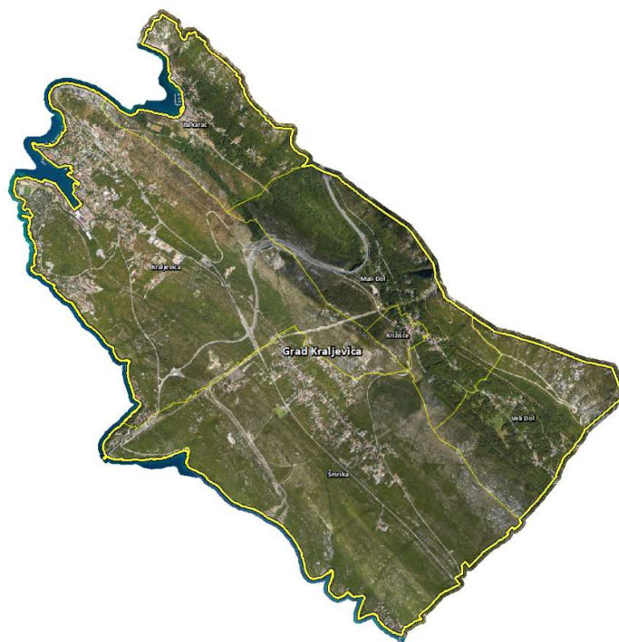
Slika 2. Administrativno područje Grada Kraljevice – Kraljevica, Šmrika, Bakarac, Križišće, Veli Dol, Mali Dol